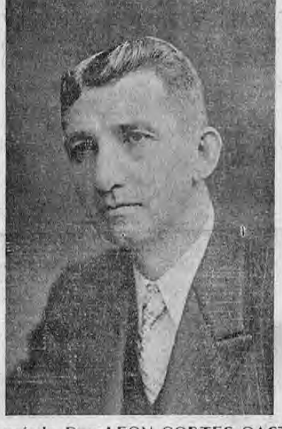
Licenciado Don LEON CORTES CASTRO