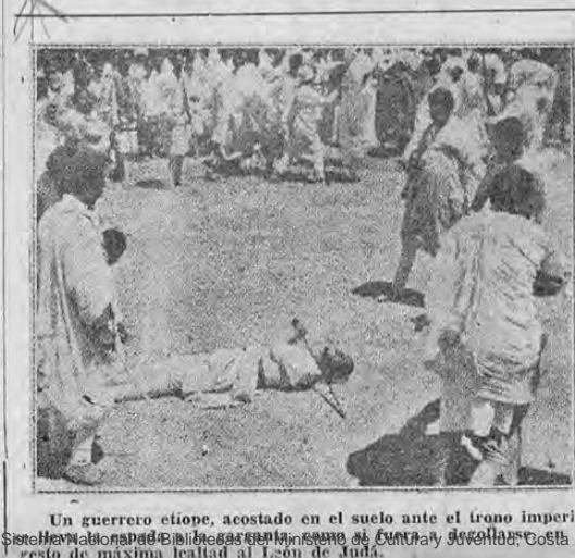
Un guerrero etiope, acostado en el suelo ante el trono imperial. Se le han lanzado bombas que le causan heridas graves en la zona abdominal y de máxima letalidad al León de Juda.

Sugiere el plan, en breve entrevista para LA TRIBUNA, el jefe del departamento agrícola del Internacional.